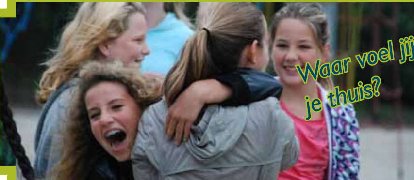
Waar voel jij je thuis?