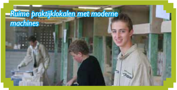
Ruime praktijklokalen met moderne machines